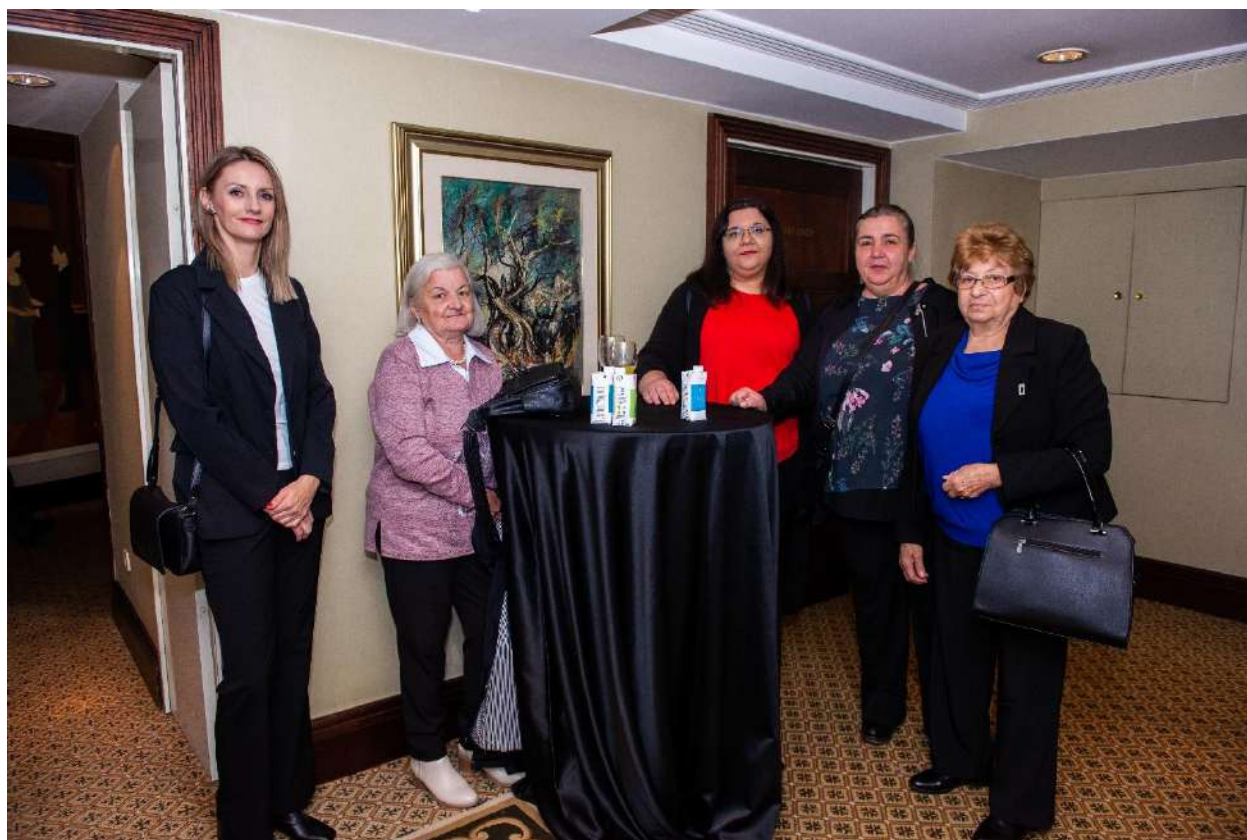
20 godinaNZZCD (06.11.)