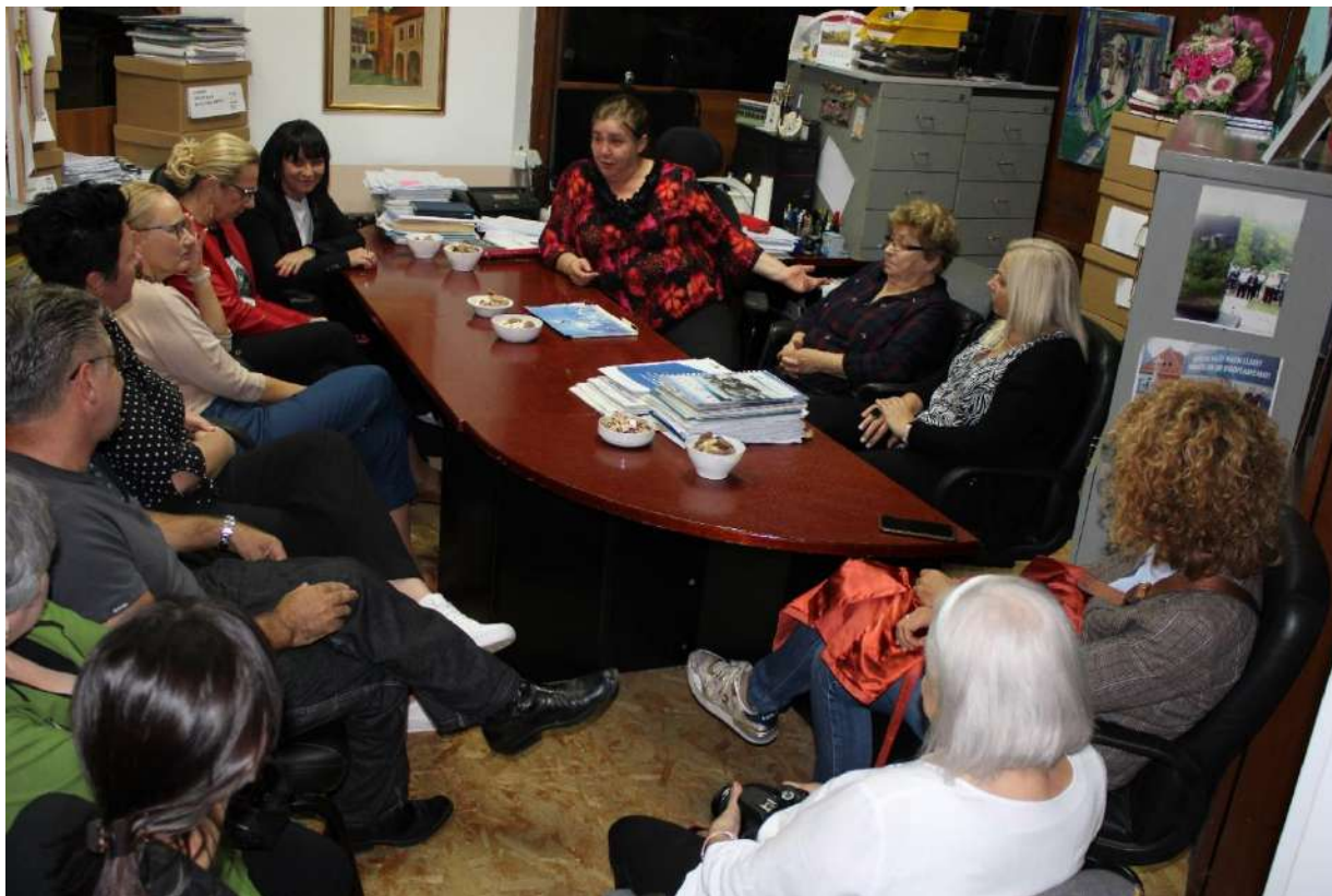
Radni sastanak u uredu u Zagrebu (25.10.)