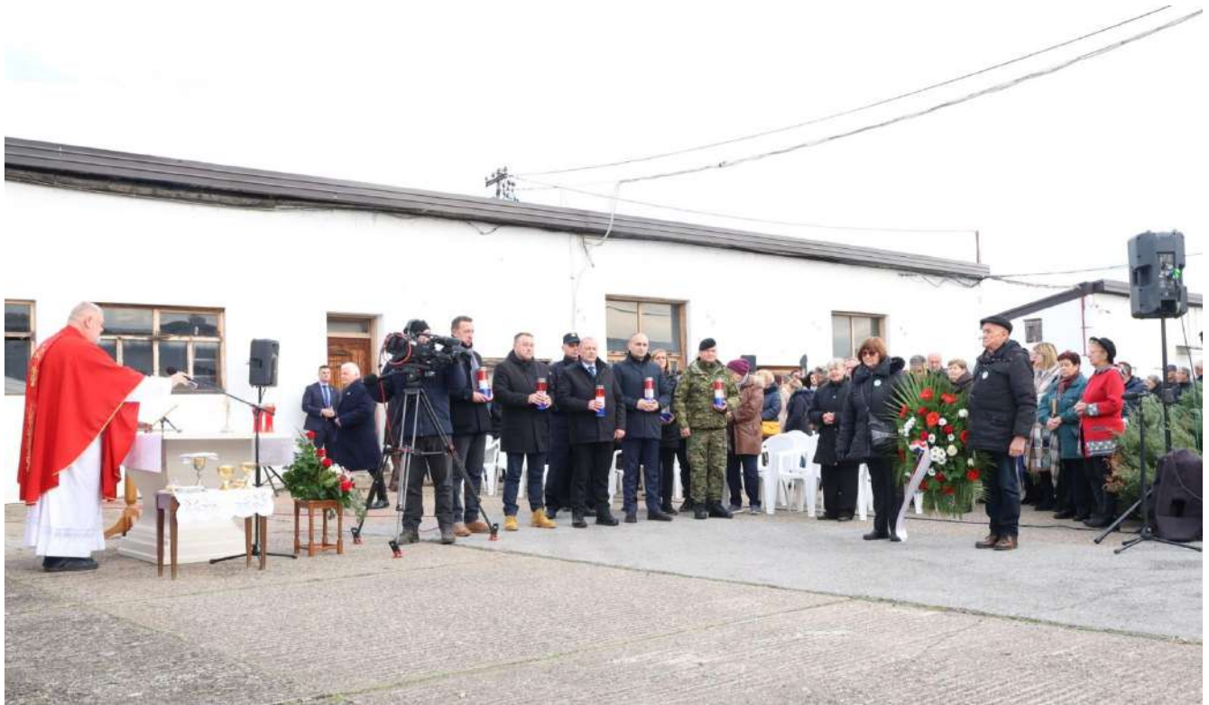
Odavanje počasti žrtvama Veleprometa, Vukovar 20.11.