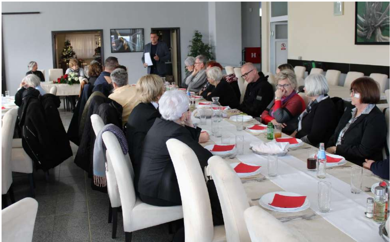
Tribina „Pravo nestalih na identitet – pravo obitelji na istinu“, Vukovar 28.12