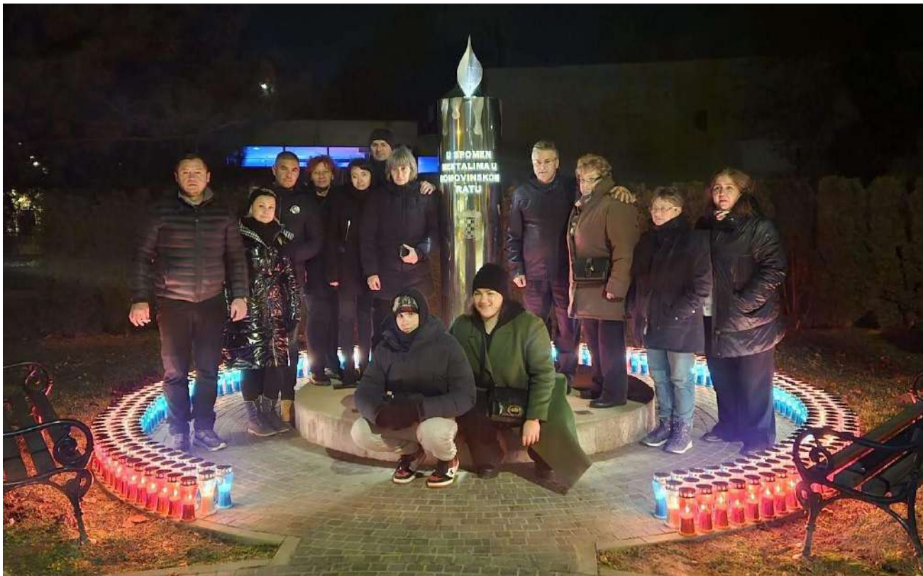
Paljenje svijeća kod spomenika Nestalim osobama u Domovinskom ratu, Vukovar 18.11.