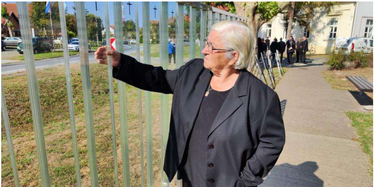
Obilježavanje Dana sjećanja na žrtve velikosrpske agresije nad mještanima Sotina 14.10.