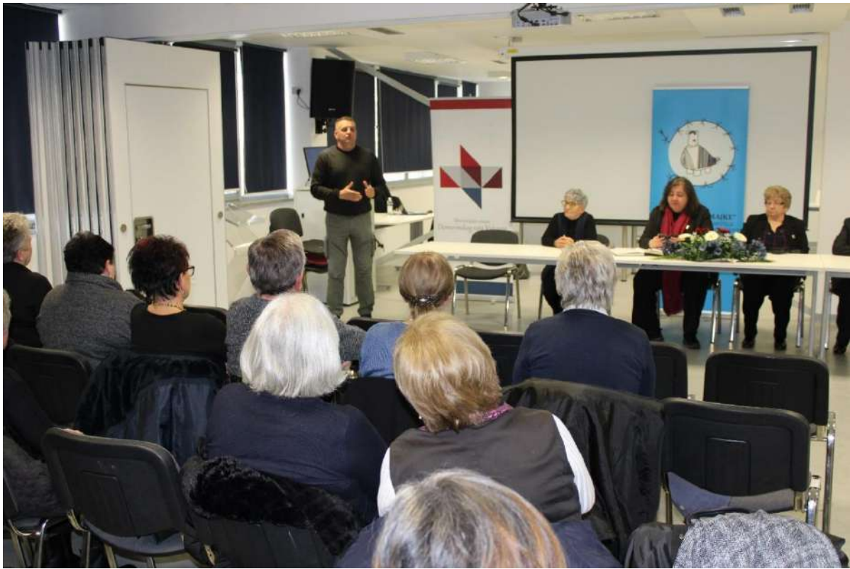
Tribina „Pravo nestalih na identitet – pravo obitelji na istinu“, Vukovar 28.02