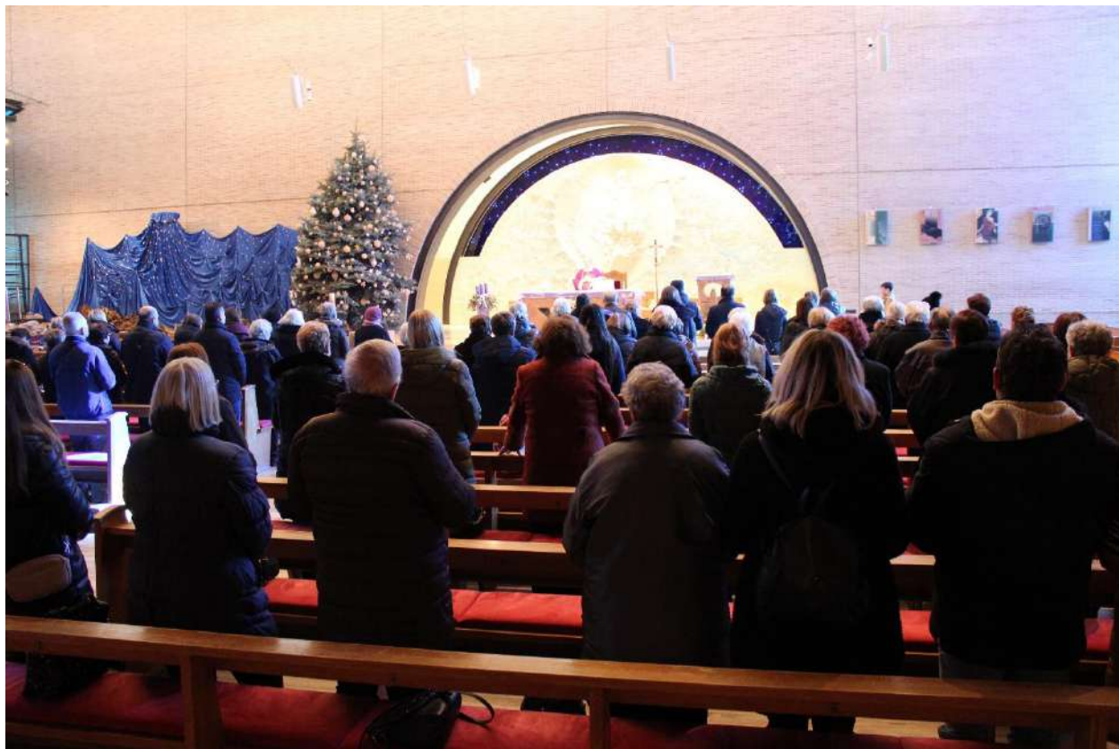
Božićni susret članova, misa u crkvi Sveta mati slobode Zagreb 18.12.