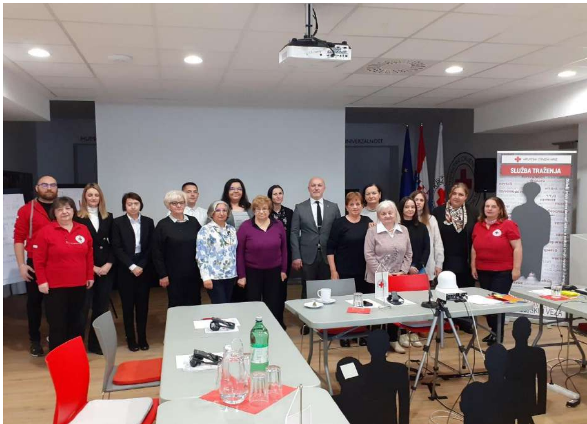
3.Međunarodna konferencija za obitelji nestalih osoba, HCK Zagreb 23.-24.11.