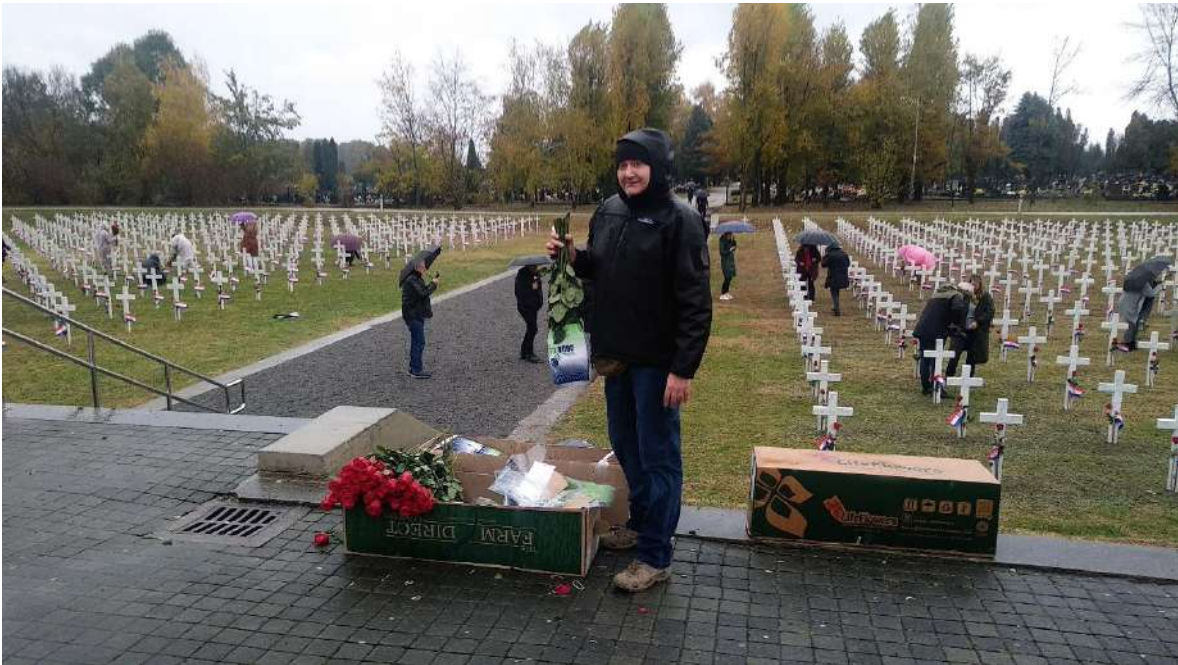
Postavljanje ruža na bijele križeve, Vukovar 17.11.