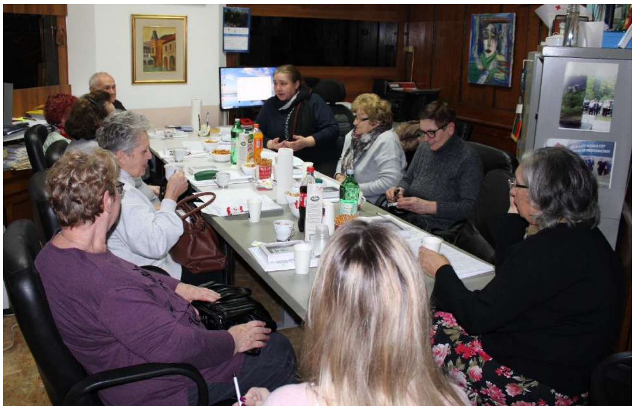
Edukativna radionica, Zagreb 29.12.