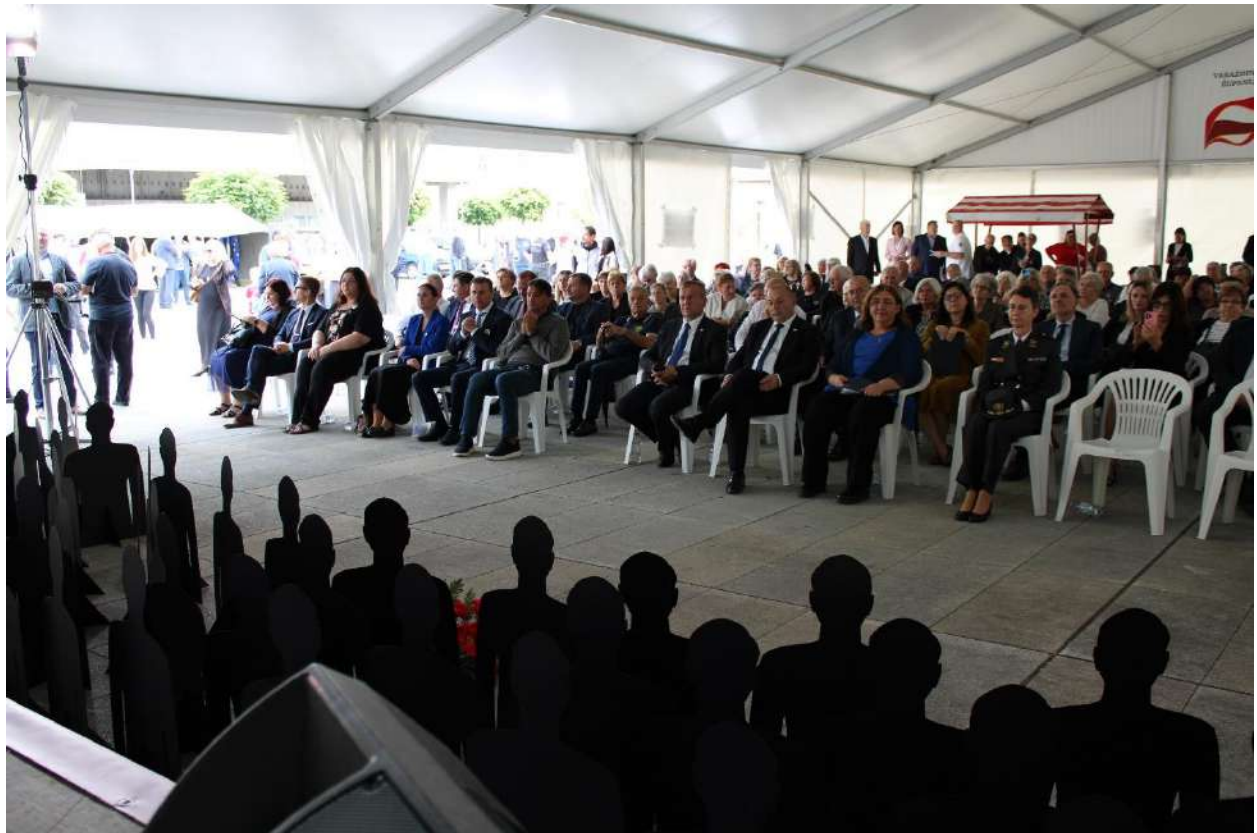
Obilježavanje Međunarodnog dana nestalih osoba i Dana sjećanja na nestale osobe u Domovinskom ratu, Varaždin 30.08.