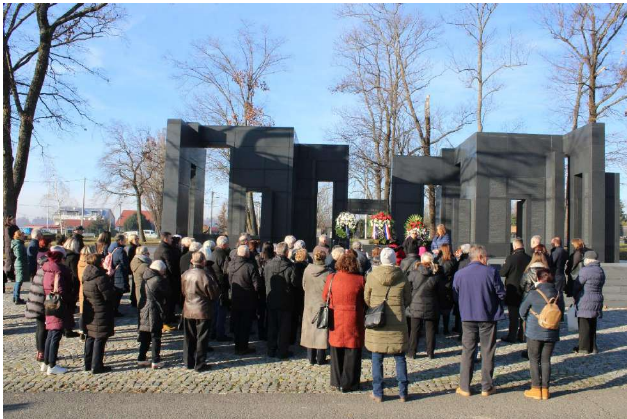
Božićni susret članova, polaganje vijenaca Zid boli Zagreb 18.12.