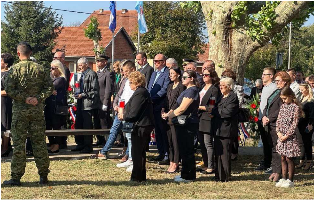
Obilježavanje Dana sjećanja na žrtve velikosrpske agresije nad mještanima Sotina 14.10.