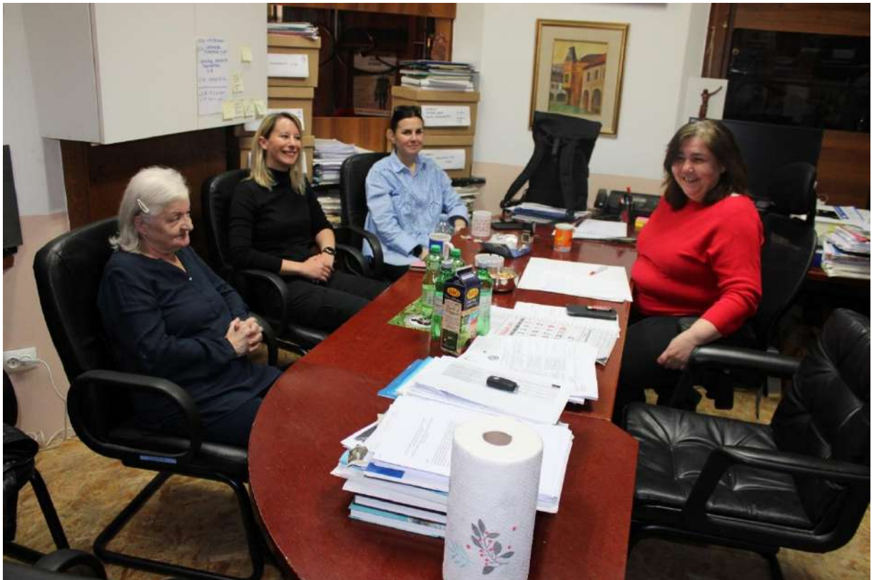
Međusektorska suradnja, ured u Zagrebu 21.03.