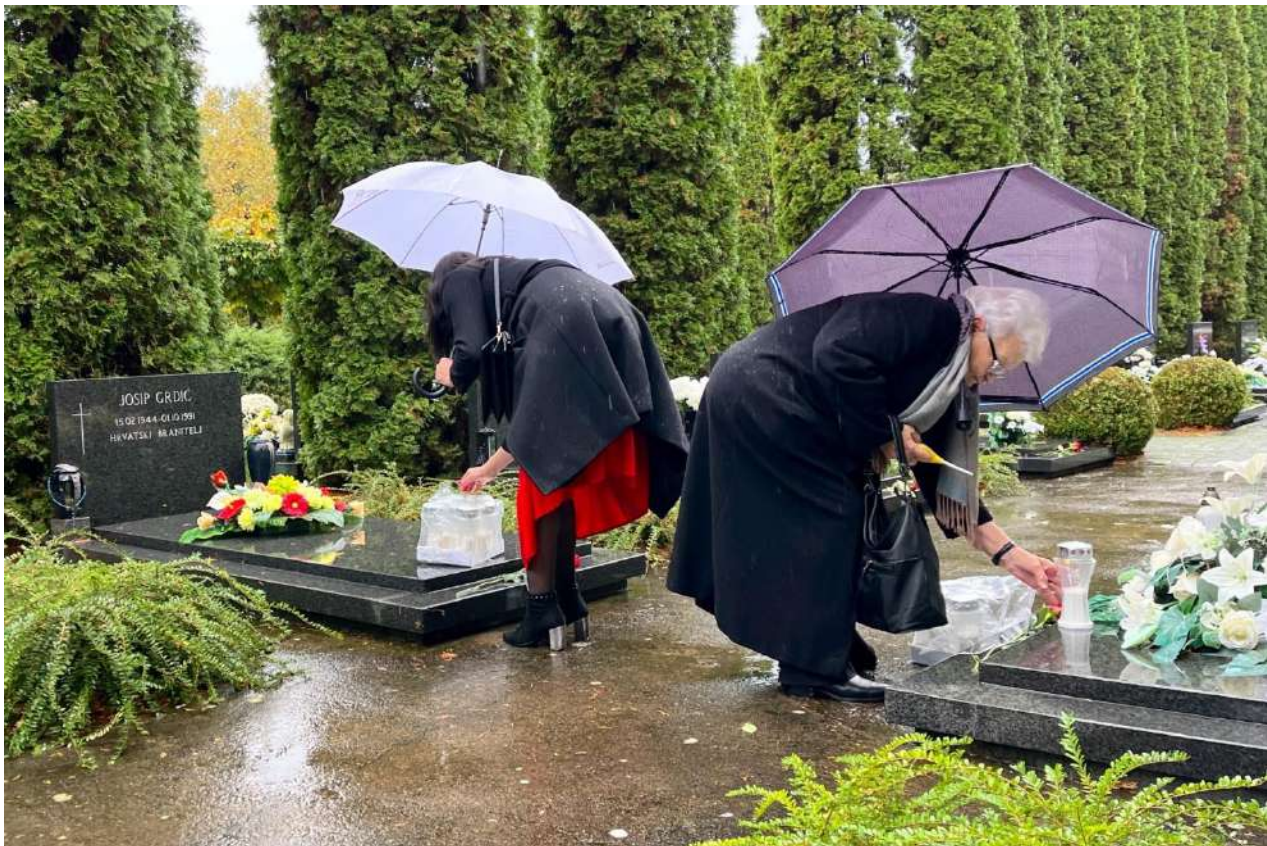
Polaganje ruža i svijeća na grobove, Vukovar 17.11.