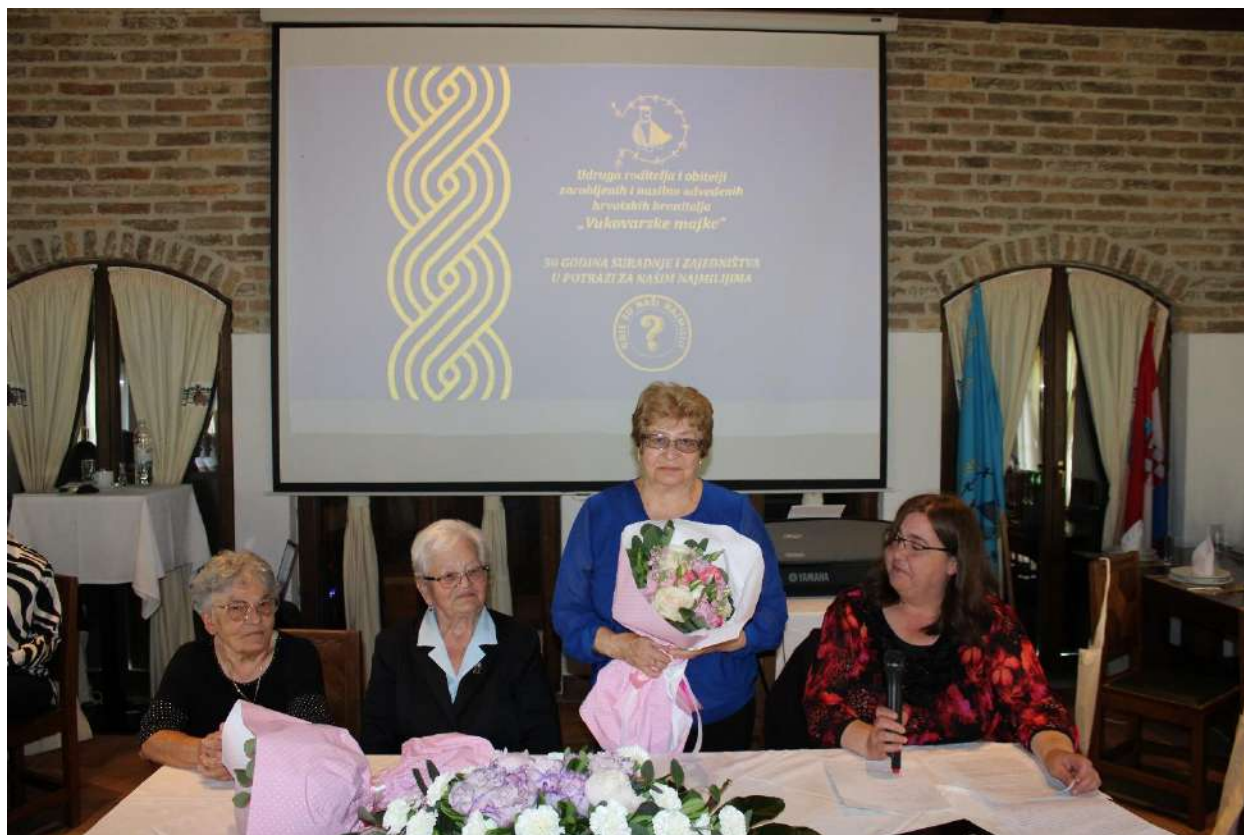
Obilježavanje 30 obljetnice udruge, Vukovar (02.06.)