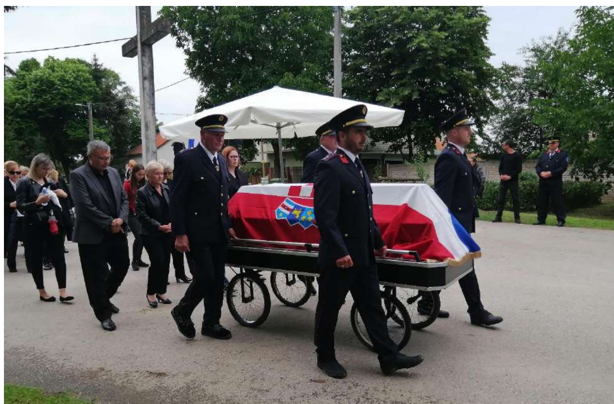
Pokop identificiranih hrvatskih branitelja i civila, Berak 16.06.