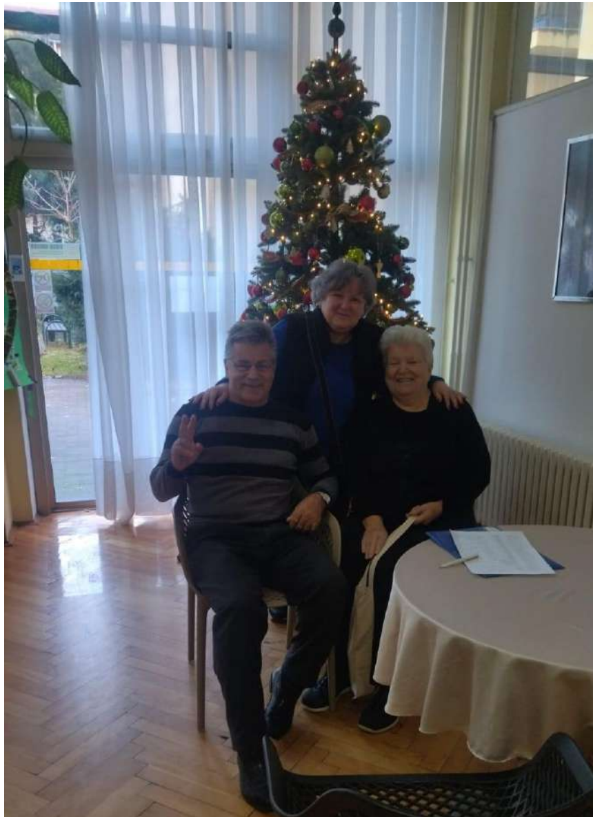
Obilazak starijih članova udruge Zagreb