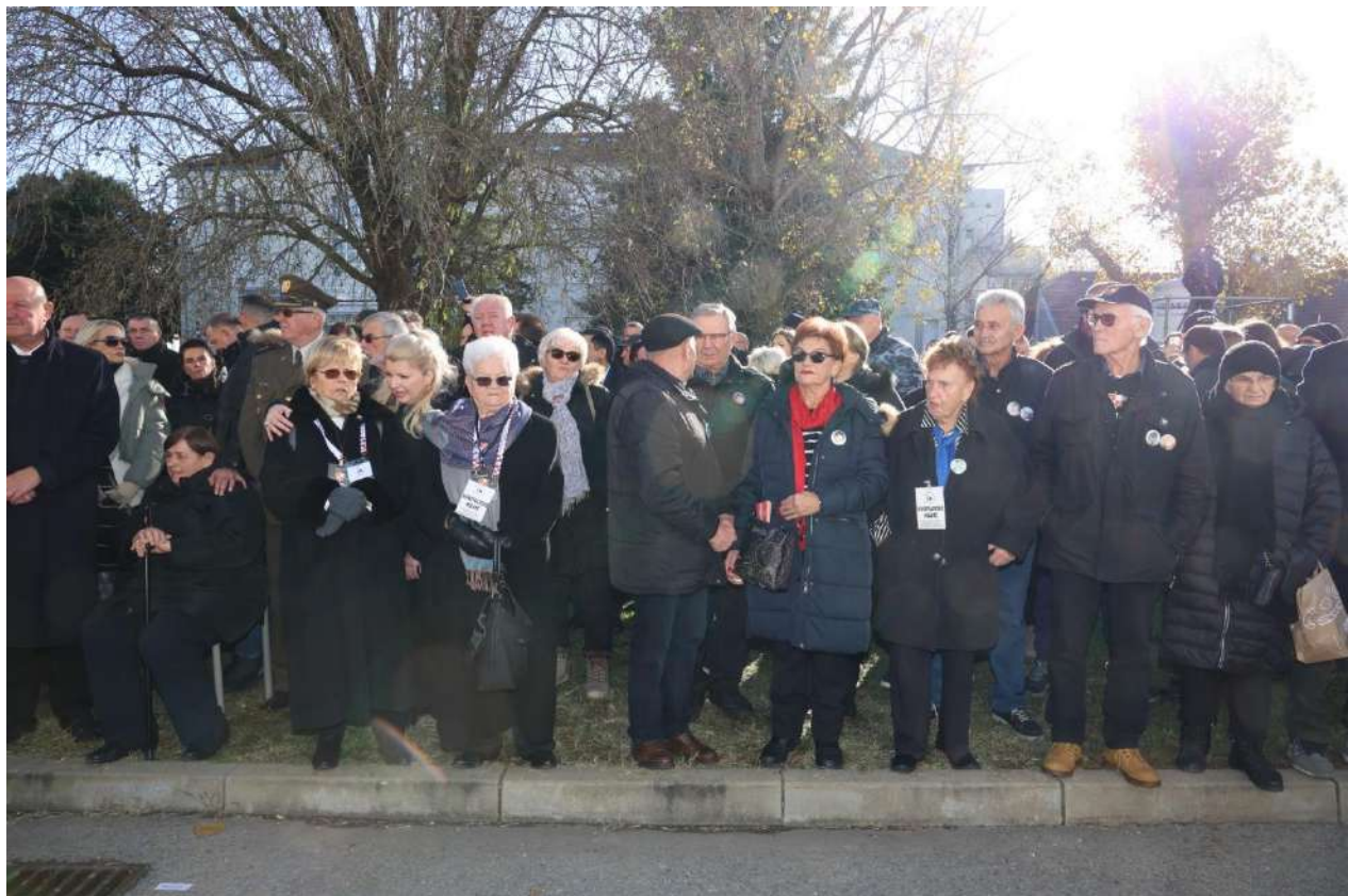
Sudjelovanje u vukovarskoj koloni sjećanja, Vukovar 18.11.