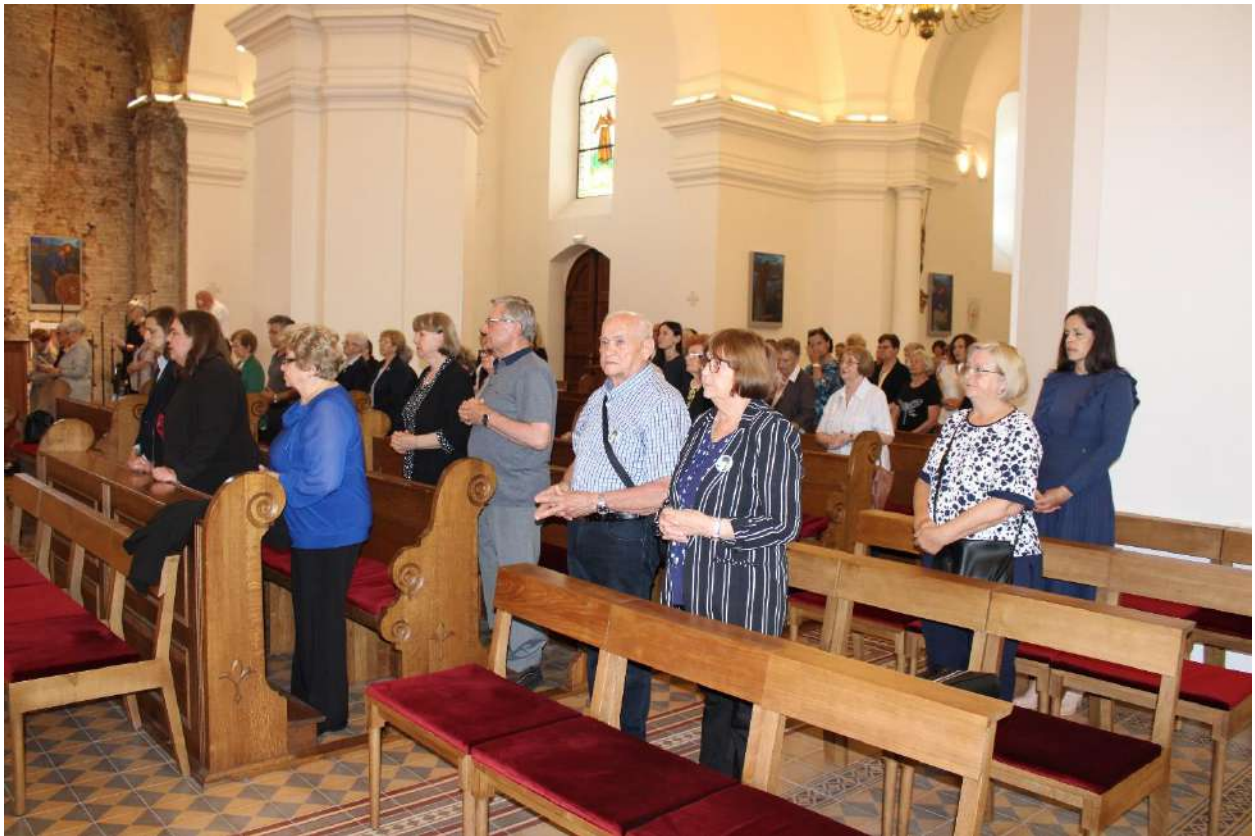
Obilježavanje 30 obljetnice udruge, Vukovar (02.06.)