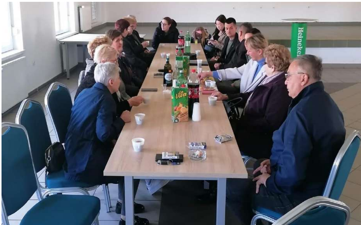
Sastanak s članovima obitelji u Berku 12.04.