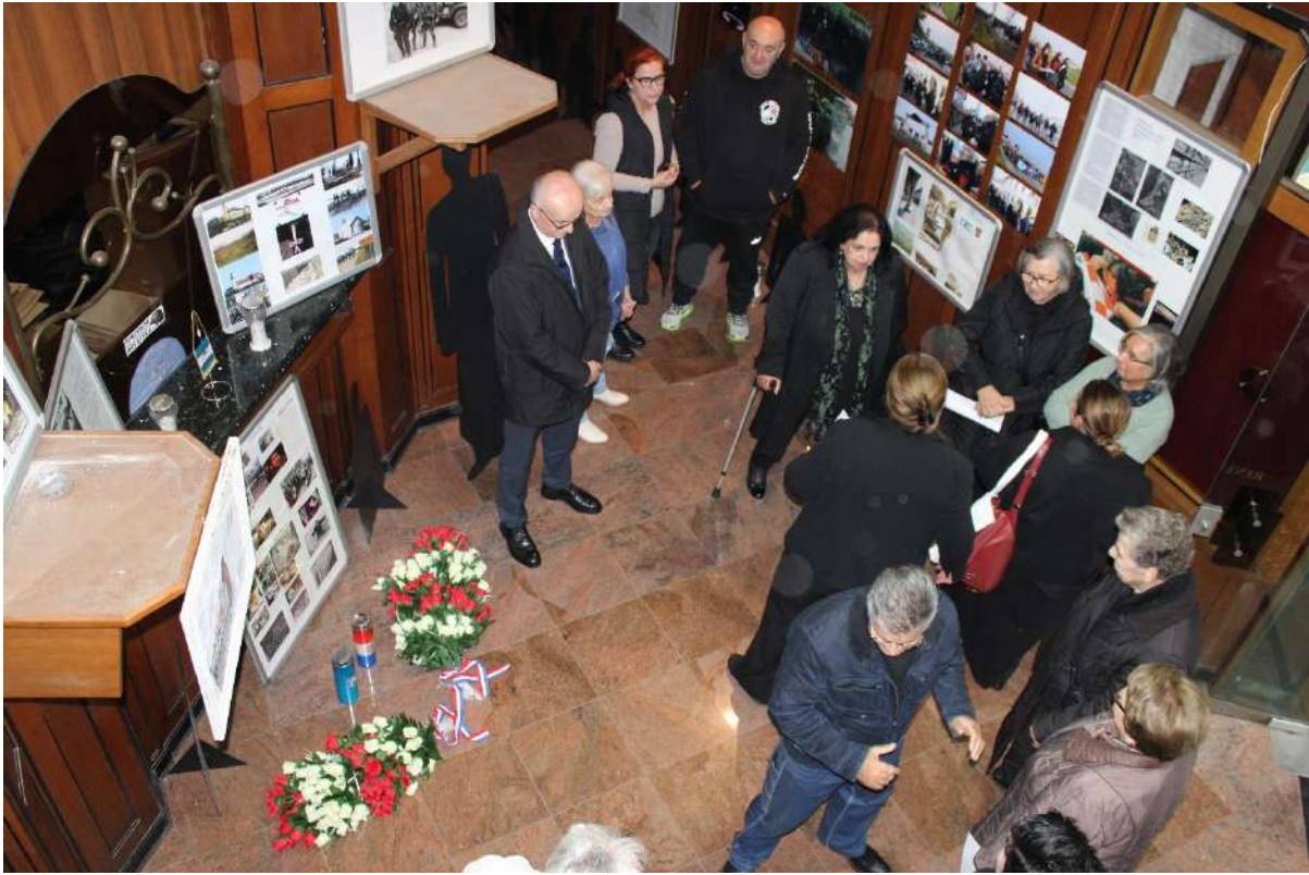
Otvaranje izložbe „Vukovar i Škabrnja u Zagrebu – 32 godine poslije, Zagreb 16.11.