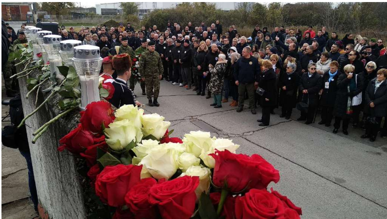
Obilježavanja "Žrtve Borovo naselja za domovinu", Vukovar 19.11.